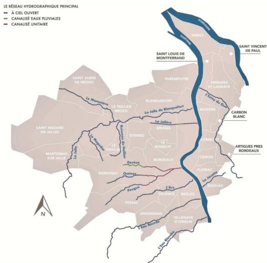
Figure 1 : Communes et cours d'eau structurants de Bordeaux Métropole