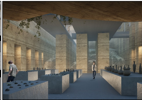
2. Le piano nobile et ses galeries creusées dans la roche